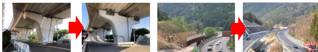
【橋梁における耐震補強工事の施工例】

※既存道路の拡幅かつ災害時に土砂崩れやのり面崩落が発生する危険性がある地域での工事等、4車線化を行うことで道路閉塞のリスクを低減することにつながるものに限る