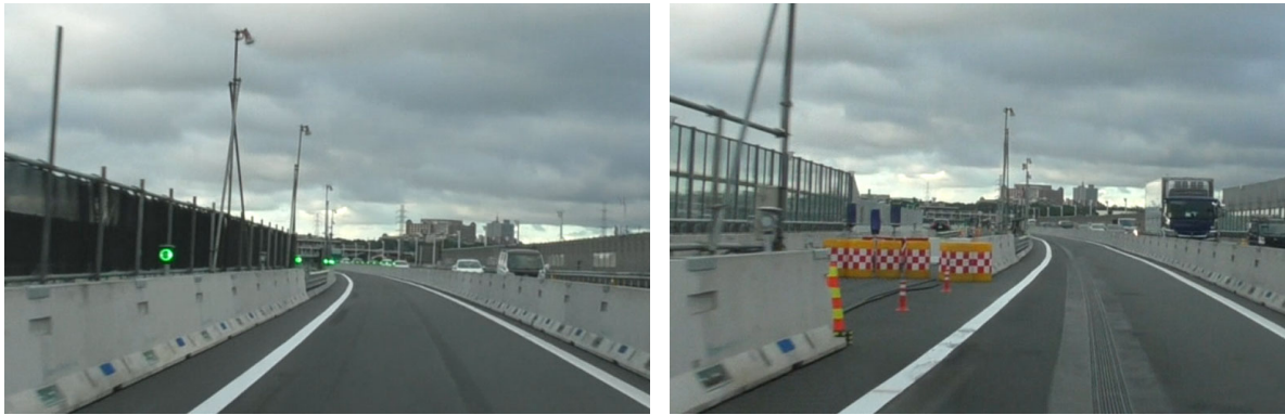
コンクリート製交通規制材による交通規制イメージ

コンクリート製で剛性が高い防護ブロックを交通規制材に採用することで、昼夜連続・車線分離規制において対向車線への突破事故を防ぎます。また、高速道路の本線上で作業する作業員の安全を確保します。