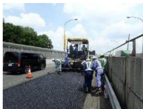
舗装工事イメージ