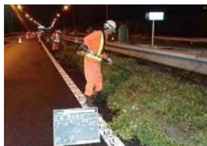
雑草の草刈りイメージ