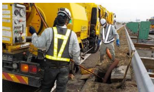
集水ますの清掃イメージ