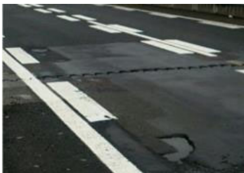
舗装の損傷状態イメージ