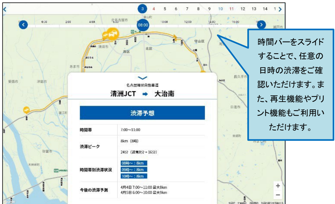
集中工事専用 WEB サイトでの渋滞予測の掲載イメージ(図は名二環の事例)

交通規制の実施に伴い、迂回やお出かけ時間の変更をご検討いただけるお客さまへの情報として、東名阪道集中工事専用 WEB サイトで渋滞が予測される日の時間帯別の渋滞予測をご案内いたします。