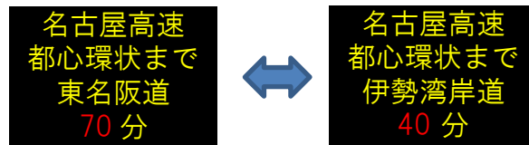
表示例) 四日市 JCT 手前