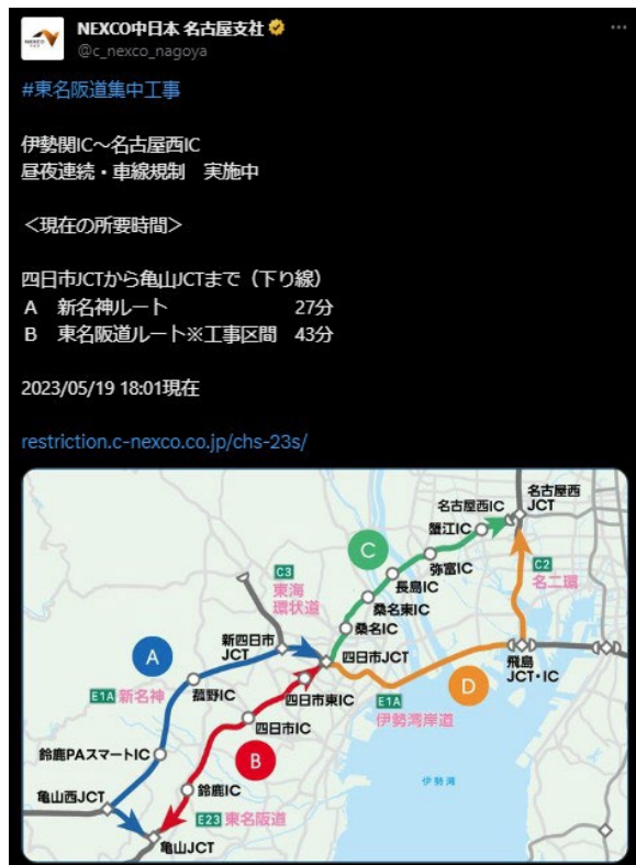
X(旧 Twitter)での交通情報提供のイメージ