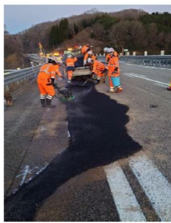
北陸道②金沢森本 IC～小矢部 IC (2024年1月2日)