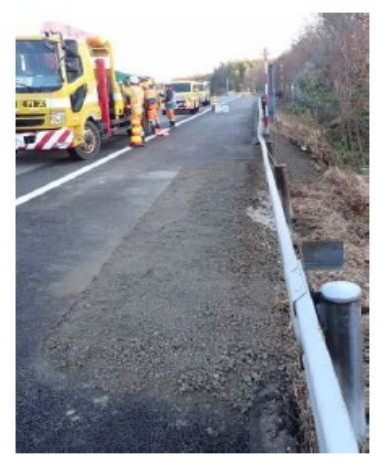
北陸道③加賀 IC～片山津 IC (2024年1月2日)