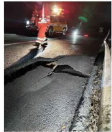
北陸道③加賀 IC～片山津 IC (2024年1月1日)