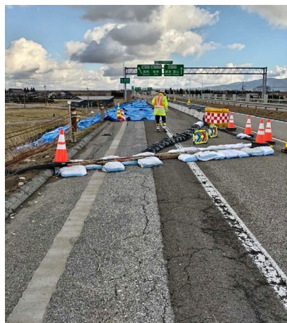
北陸道①小矢部砺波 JCT 付近 (2024年1月4日)