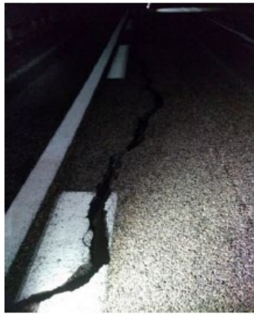
北陸道②金沢森本 IC～小矢部 IC (2024年1月1日)