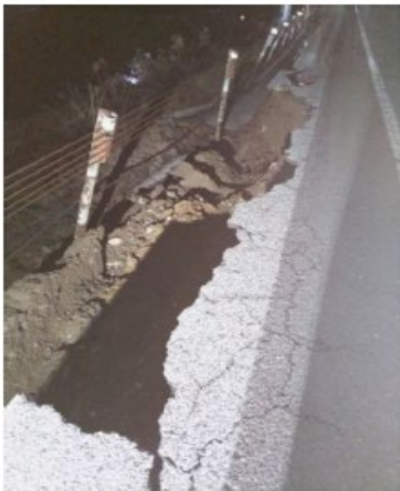
北陸道①小矢部砺波 JCT 付近 (2024年1月1日)