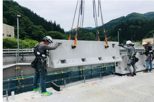
壁高欄新設状況（イメージ）