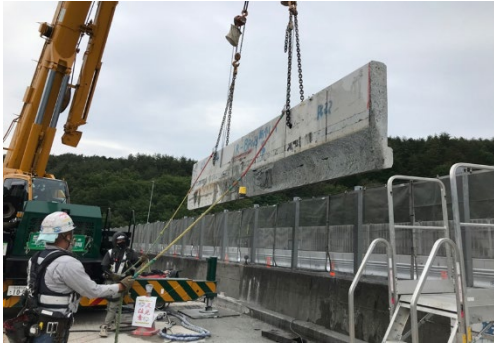
壁高欄撤去状況（イメージ）

※園原 IC では 2024 年 3 月以降にも定期的な出口閉鎖を予定しています。詳細はあらためてお知らせいたします。