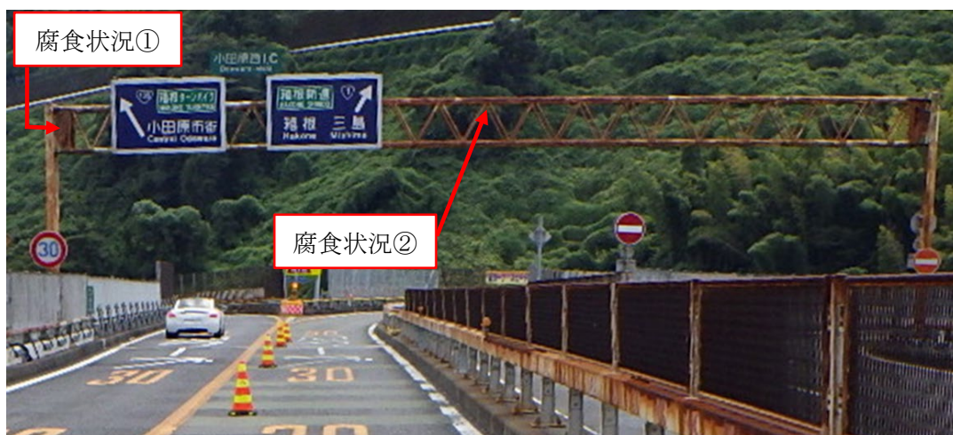
【小田原厚木道路 小田原西 IC(上下線)ランプ部】