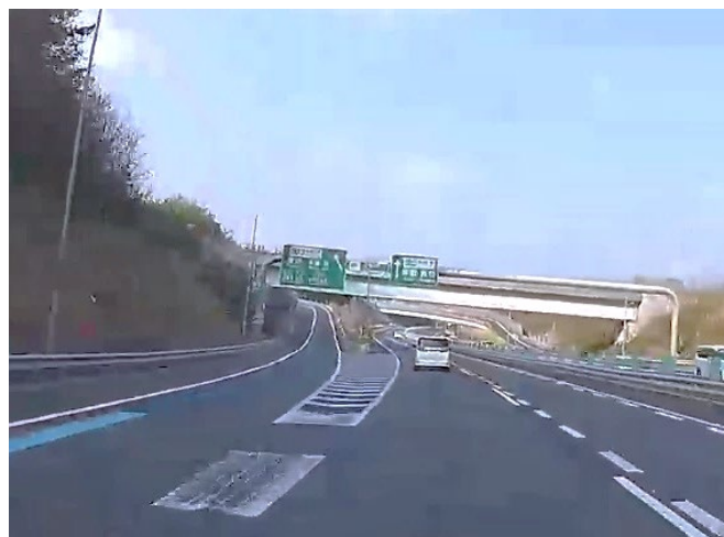
元の車線位置 (写真はリニューアル工事前の状況)