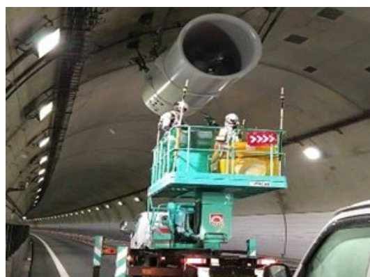
ジェットファン点検