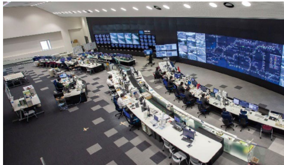
24 時間の道路監視体制

きめ細かな情報提供とお客さまの安全のために、交通規制区間に設置した渋滞計測機器を活用し、24 時間体制で道路状況を監視するとともに、情報板や渋滞末尾警戒車、ハイウェイラジオ、みちラジ(スマートフォンアプリ、NEXCO 中日本管内のみ)でリアルタイムの情報をお知らせいたします。