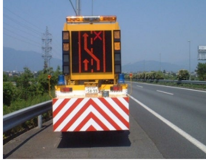
渋滞末尾警戒車による注意喚起

交通規制箇所や渋滞末尾での追突事故を防止するための注意喚起として、交通規制箇所の手前または渋滞状況に応じて渋滞末尾付近の路肩に渋滞末尾警戒車を配置して注意を呼びかけます。