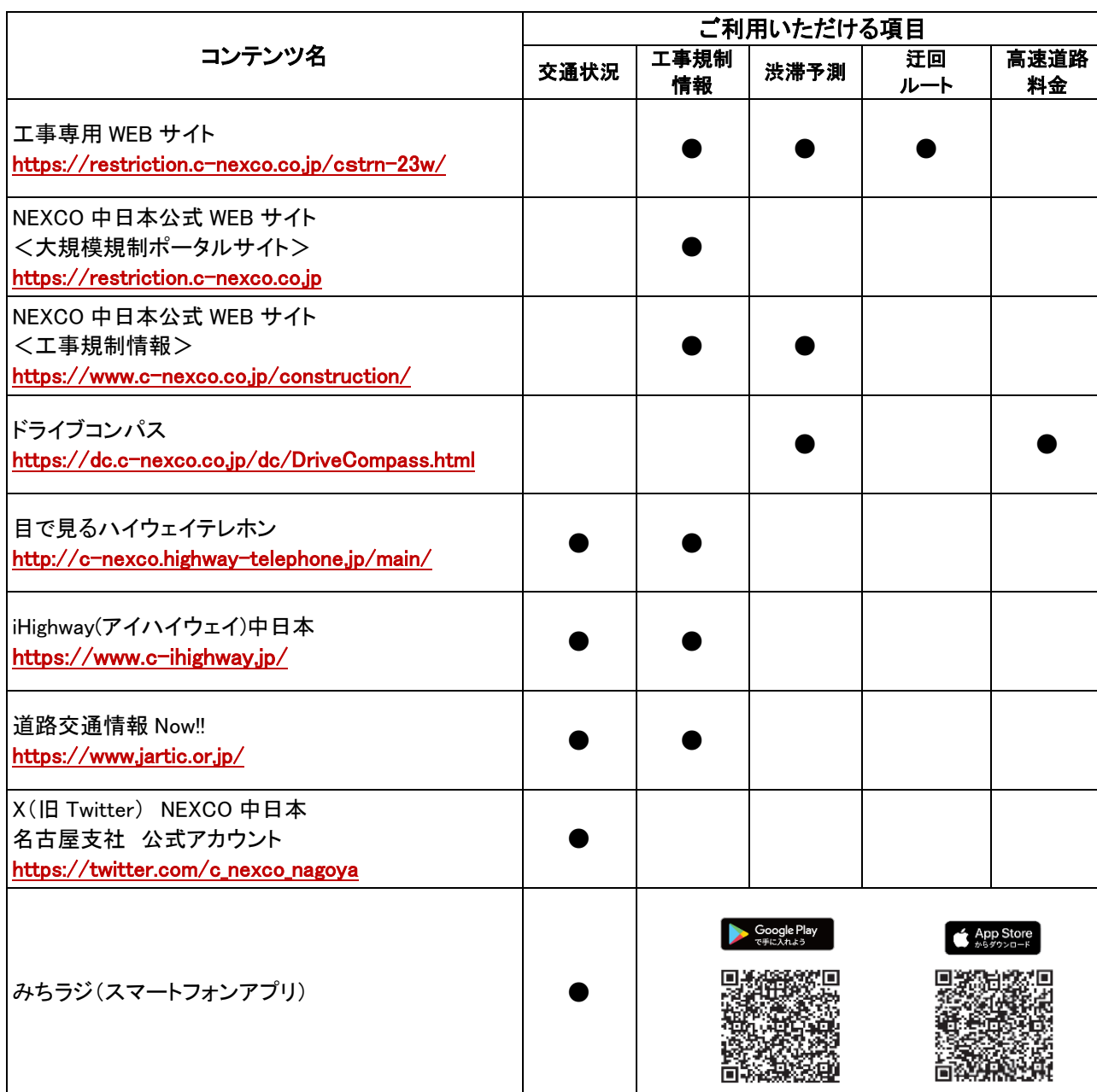
道路交通情報や工事に関する情報の確認方法一覧

なお、自動車運転中のドライバーの携帯電話の使用は法律で禁止されています。携帯電話をご利用の際はサービスエリア(SA)・パーキングエリア(PA)でお願いいたします。