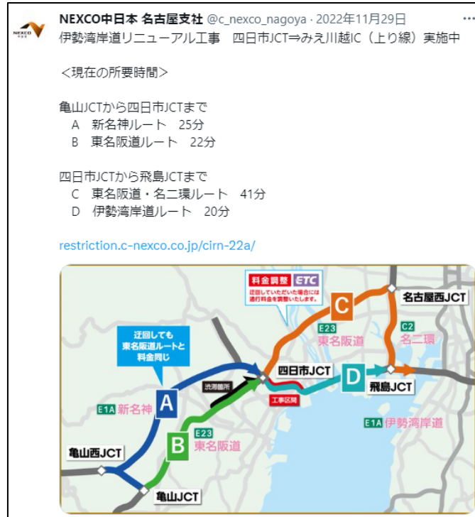
X(旧 Twitter)でのリアルタイムの所要時間情報提供のイメージ