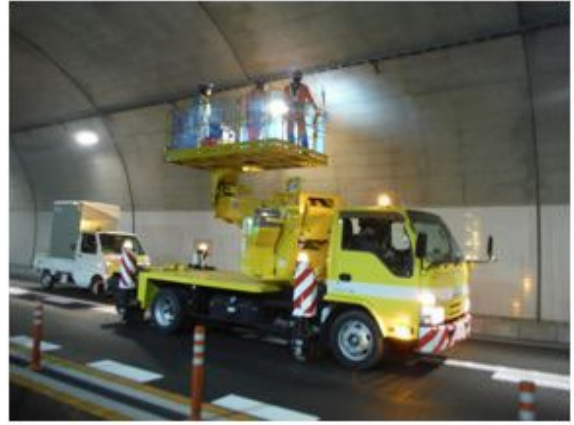
<トンネル照明設備点検>