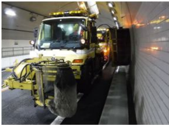
<トンネル壁面清掃>