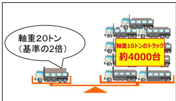
床版に与えるダメージ