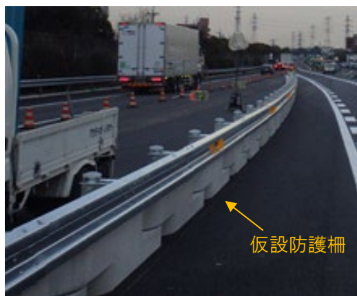
仮設防護柵の設置 (イメージ)

飛驒清見 IC(下り線)出口 ランプ橋の橋梁補修工事を実施するにあたり、安全な作業空間を確保するために、一時的に仮設防護柵を設置し、補修工事の完了後には撤去する作業をおこないます。