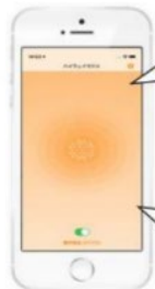
画面イメージ (音声受信時)

通行止めの情報です。 ○○インターから●●インターまでの間で、事故のため、通行止めになっています。