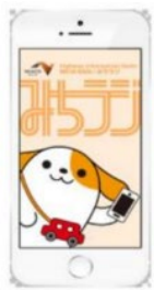
画面イメージ (アプリ起動時)

※プッシュ通知とは、機器を操作することなくアプリが自動的にお知らせを発信する機能