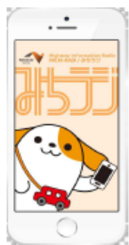
図-1 画面イメージ (アプリ起動時)

https://www.c-nexco.co.jp/pdf/common/michiradi.pdf