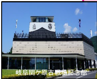
岐阜関ヶ原古戦場記念館