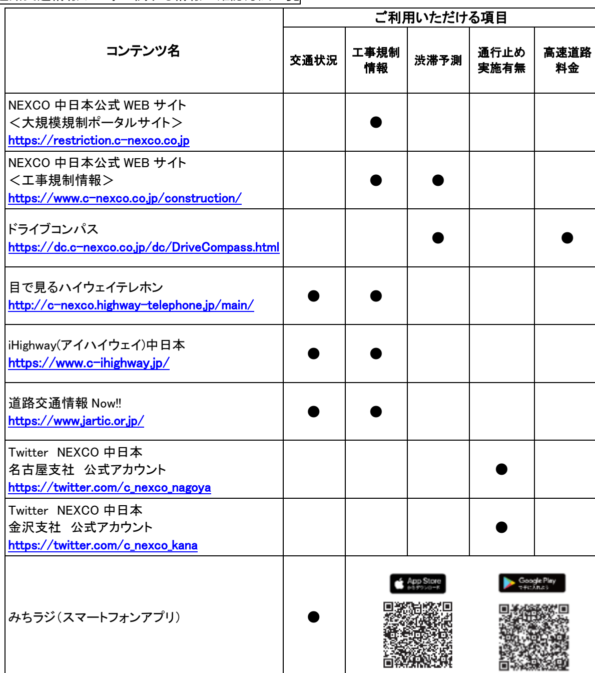
道路交通情報や工事に関する情報の確認方法一覧

なお、自動車運転中のドライバーの携帯電話の使用は法律で禁止されています。携帯電話をご利用の際はSA・PA をお願いいたします。