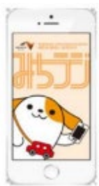
画面イメージ (アプリ起動時)

※プッシュ通知とは、機器を操作することなくアプリが自動的にお知らせを発信する機能