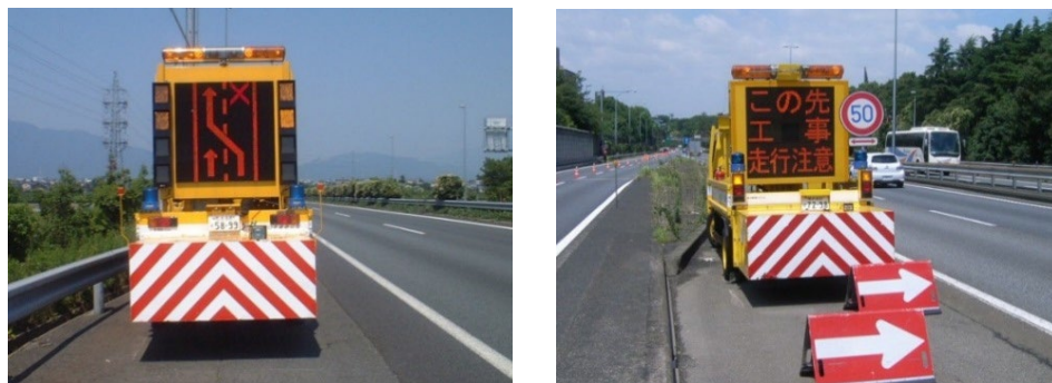
【渋滞末尾警戒車の配置例】

渋滞末尾での追突事故を防ぐため、渋滞末尾付近の路肩に標識車を配置し、この先の交通状況や規制状況をお伝えします。