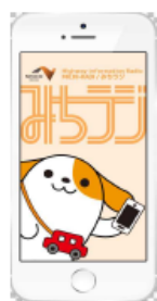
図-1 画面イメージ(アプリ起動時)