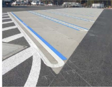
青色ラインでの「普通車・大型車兼用マス」の明示例