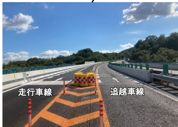
走行車線と追越車線を分離した車線運用(イメージ)