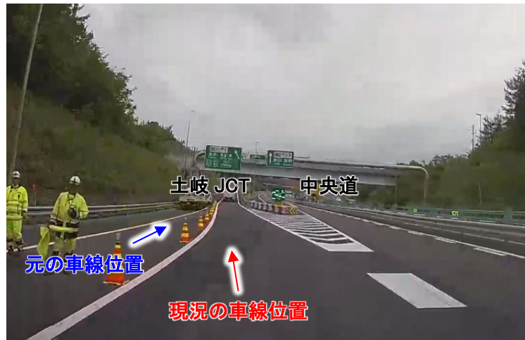
中央道 上り線(東京方面)から東海環状道に向かうランプ分岐部の現況

現在実施している中央道リニューアル工事に伴い、土岐 JCT の中央道 上り線(東京方面)から東海環状道に向かうランプの車線をシフトしていましたが、夏季交通混雑期における工事規制の一時解除に伴い、車線位置を元に戻す作業をおこないます。