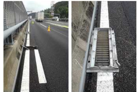
脱落した集水ますの蓋

※本件による車両損傷にお心あたりのある方は、以下のお問い合わせ先までご連絡ください。