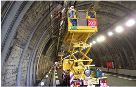
高所作業車によるトンネル設備の点検状況