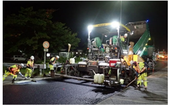
損傷した舗装の補修状況