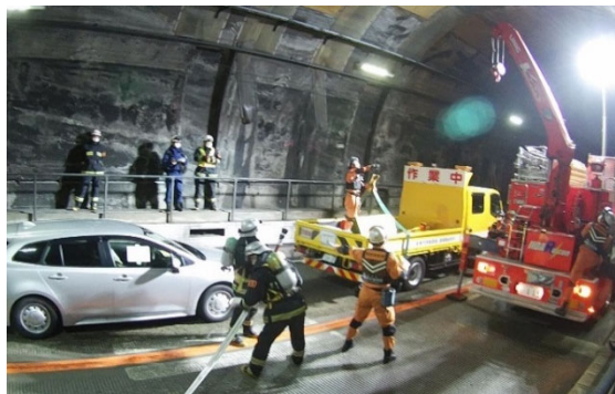
消防及び警察と連携したトンネル内の合同防災訓練

恵那山トンネルにおいて、多重衝突事故および事故に伴う火災を想定した防災訓練をおこないます。