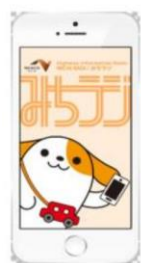
画面イメージ (アプリ起動時)

※プッシュ通知とは、機器を操作することなくアプリが自動的にお知らせを発信する機能