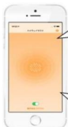
画面イメージ (音声受信時)

通行止めの情報です。 ○○インターから●●インターまでの間で、事故のため、通行止めになっています。