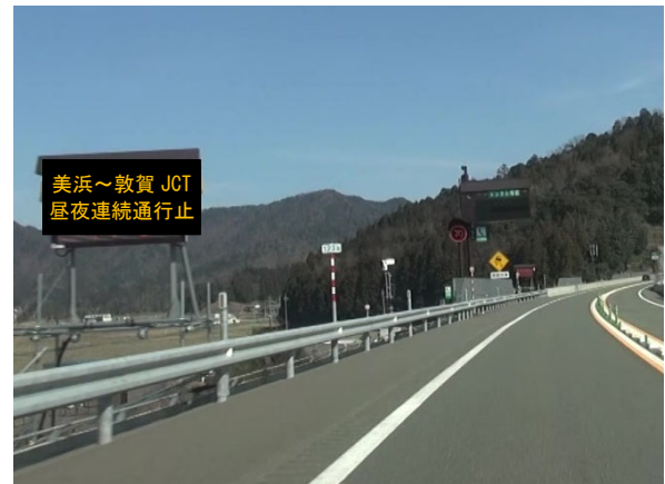
《 特設情報板による情報提供（イメージ） 》