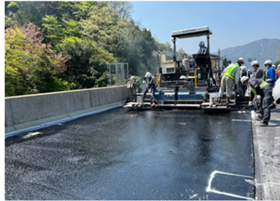
《 床版防水工施工状況 》