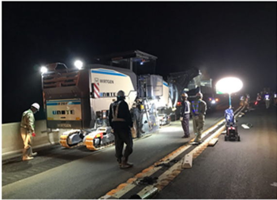
《 傷んだ舗装撤去状況 》