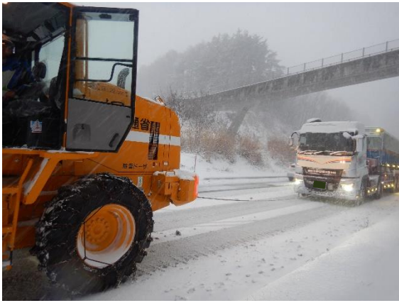
スタック車両の牽引状況 (R5. 1. 24 国道 20 号塩尻市)