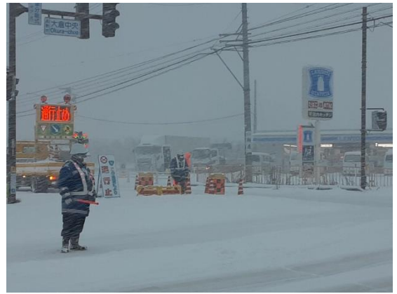
通行止め状況 (R5. 1. 24 国道 18 号長野市豊野町大倉)