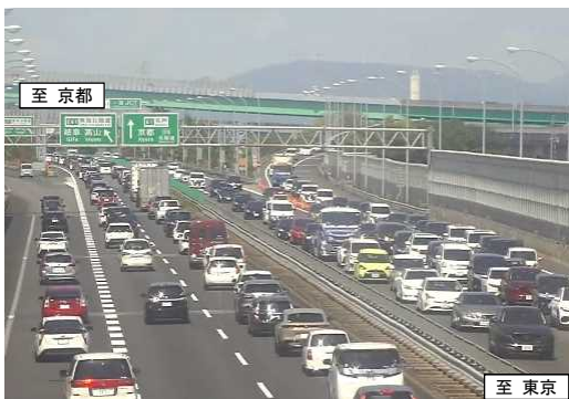
<一宮ジャンクション付近の渋滞状況（2022.5）>