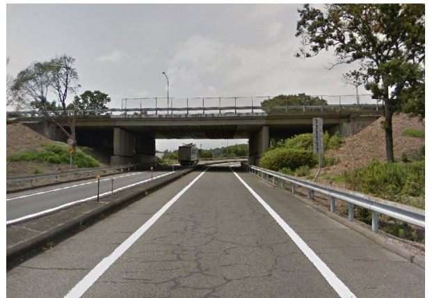
車線復旧後の車線(久居 IC の着手前)