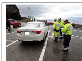
調査状況写真(道の駅「河野」)