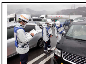
啓発状況写真(南条サービスエリア)