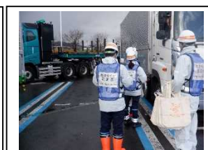
調査状況写真(南条サービスエリア)