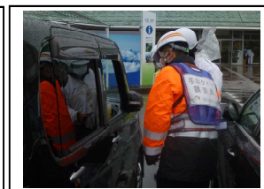
啓発状況写真(道の駅「みくに」)