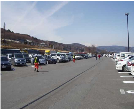
③休憩施設などでの駐車場整理員の配置