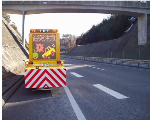
②渋滞末尾への追突注意喚起