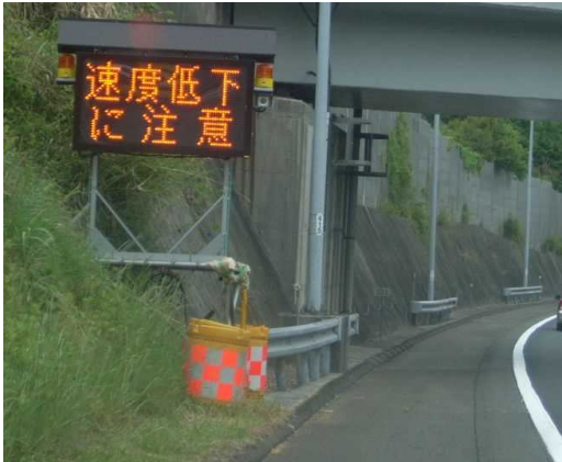
①上り坂などでの速度低下注意喚起