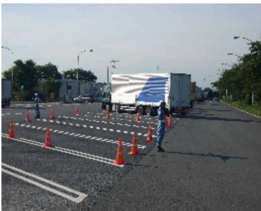
⑤大型車駐車場の確保