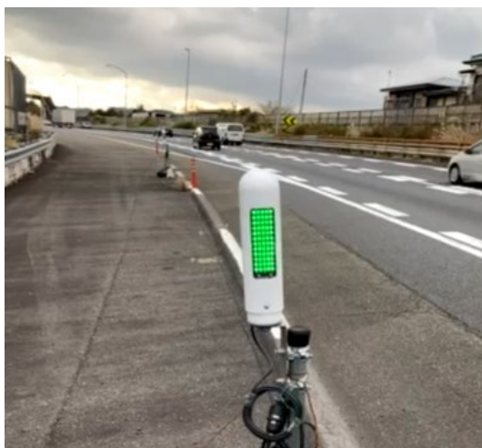
【路面点滅誘導灯の配置例】

本線の路面上に、設定した速度に合わせてLEDライト点滅する路面点滅誘導灯を設置することで、渋滞時や規制開始個所の速度低下に対する速度回復効果および視認性向上を図ります。