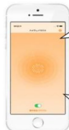
画面イメージ (音声受信時)

通行止めの情報です。 ○○インターから●●インターまでの間で、事故のため、通行止めになっています。