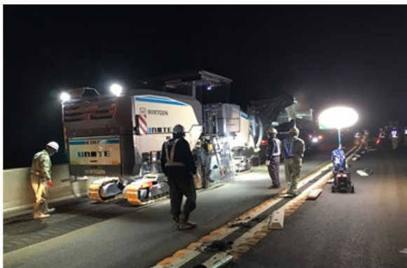
《傷んだ舗装撤去状況》

橋梁の床版※に雨水などが浸透すると床版の耐荷力や耐久性に悪影響を及ぼすため、浸透しないよう防水層を設けています。舗装損傷（ポットホールなど）に伴い防水層も損傷しているため、損傷した防水層の再施工をおこないます。