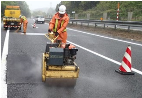
《路面損傷箇所の補修》

走行安全性・快適性の確保のため、舗装面のひび割れや段差などが顕著に発生している箇所を修復する舗装補修工事をおこないます。