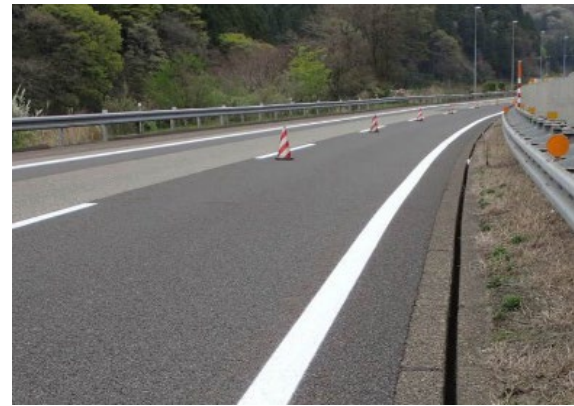
《路面標示工の施工》