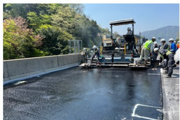
《床版防水工施工状況》