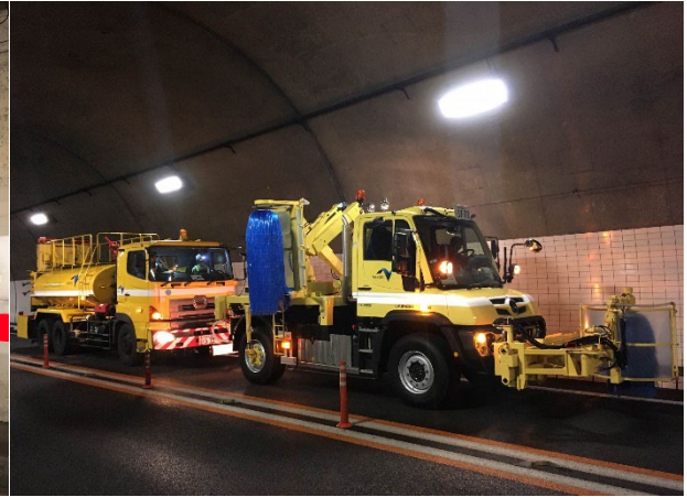
《トンネル側壁清掃》