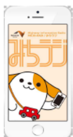
図-1 画面イメージ(アプリ起動時)

※プッシュ通知とは、機器を操作することなくアプリが自動的にお知らせを発信する機能