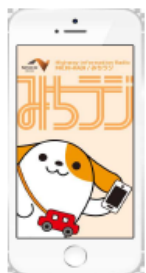
図-1 画面イメージ(アプリ起動時)

※プッシュ通知とは、機器を操作することなくアプリが自動的にお知らせを発信する機能