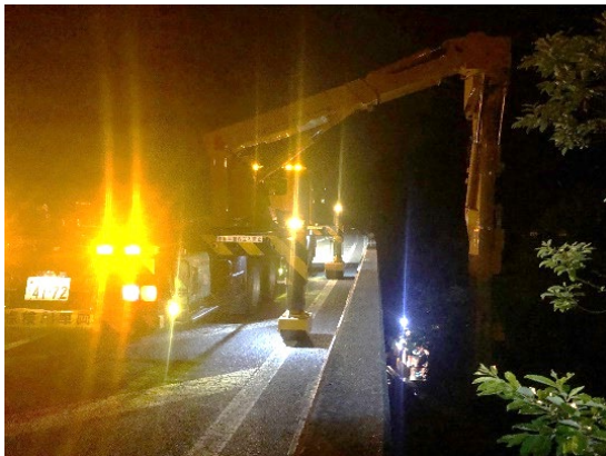
<点検車を使用した橋梁の点検(イメージ)>