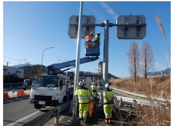
<標識などの設備の点検(イメージ)>