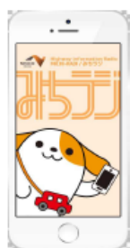
図-1 画面イメージ(アプリ起動時)

※プッシュ通知とは、機器を操作することなくアプリが自動的にお知らせを発信する機能