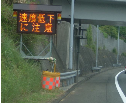
①上り坂などでの速度低下注意喚起