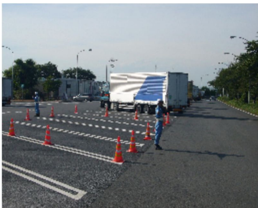
⑤大型車駐車場の確保