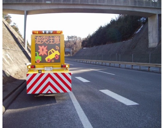
②渋滞末尾への追突注意喚起