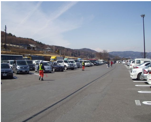
③休憩施設などでの駐車場整理員の配置