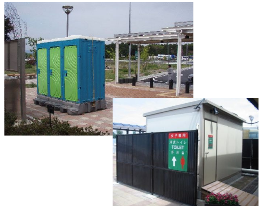
④臨時トイレの設置