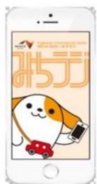
画面イメージ (アプリ起動時)

※プッシュ通知とは、機器を操作することなくアプリが自動的にお知らせを発信する機能