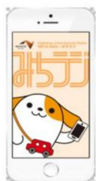
画面イメージ (アプリ起動時)

※プッシュ通知とは、機器を操作することなくアプリが自動的にお知らせを発信する機能