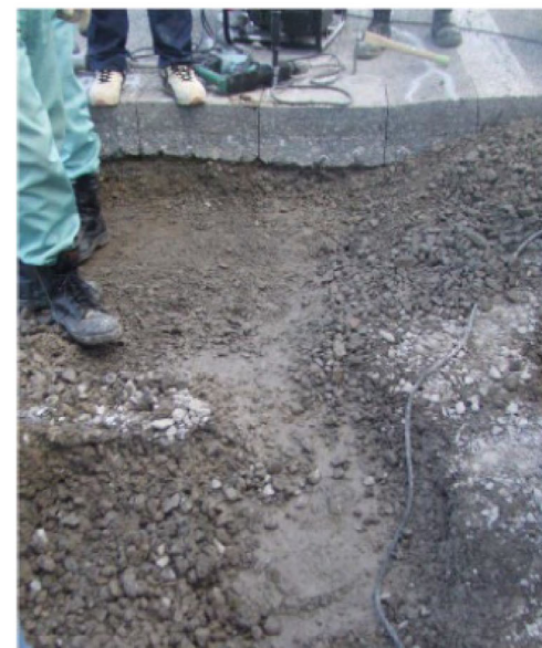
写真-1 深層部の滞水・泥土化に水が浸透している事例