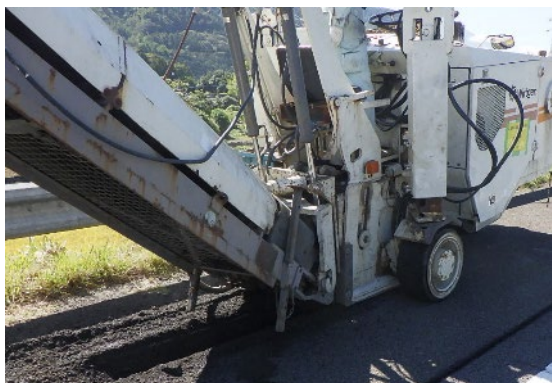
路面切削(イメージ)