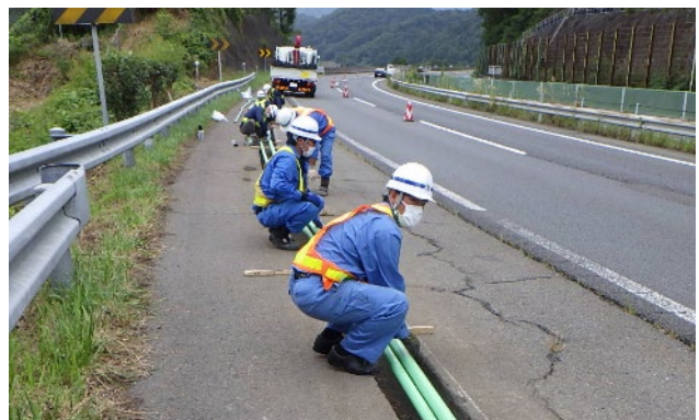
管路敷設(イメージ)