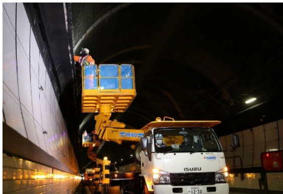
設備点検(イメージ)