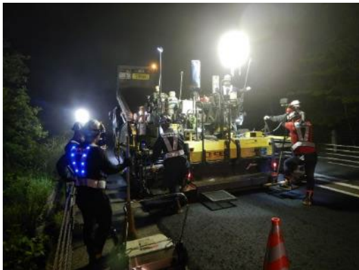
舗装工事(イメージ)