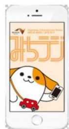
画面イメージ (アプリ起動時)