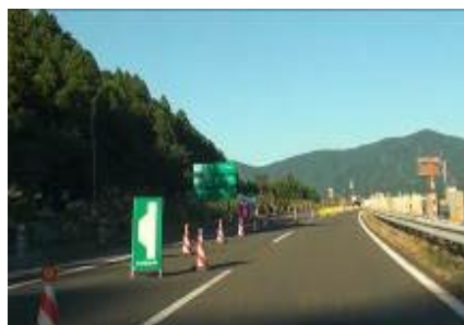
非常用駐車帯の設置例