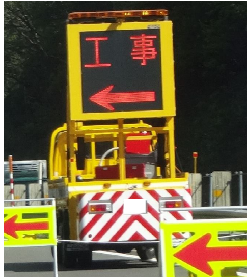
渋滞末尾警戒車の配置例

工事規制箇所や渋滞末尾での追突事故を防止するための注意喚起として、渋滞状況に応じて、工事規制箇所の手前もしくは渋滞末尾付近の路肩に渋滞末尾警戒車を配置します。