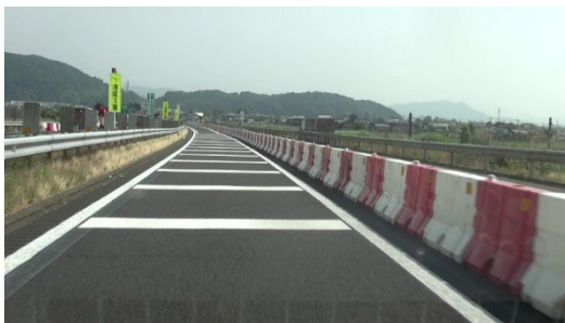
対面通行シフト部の薄層舗装設置例

対面通行シフト部へ薄層舗装の設置(振動による注意喚起)、水充填式防護柵天端へ発光灯具の設置(夜間視認性の向上)などにより交通規制区間における事故の低減に取り組みます。また、非常駐車帯を設置することにより、車両故障や事故の際の駐車スペースを確保します。