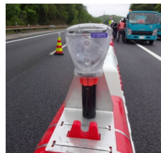
視認性向上のための発光灯具設置例