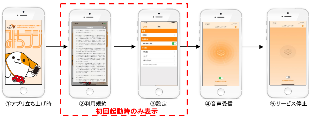
図2 アプリ起動後の画面遷移