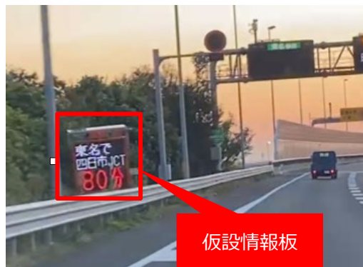
仮設情報板の設置状況・交通情報提供のイメージ

工事期間中は、工事区間を含む主な目的地への所要時間情報を提供するため、JCT 手前等に仮設情報板を設置いたします。走行ルートを検討される際にご活用ください。