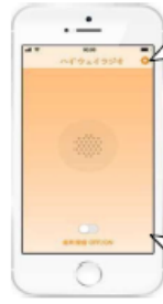
図-2 画面イメージ (音声受信時)

通行止の情報です。 ○○インターから●●インターまでの 間で、事故のため、通行止めになって います。