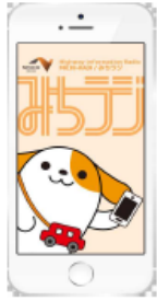
図-1 画面イメージ (アプリ起動時)