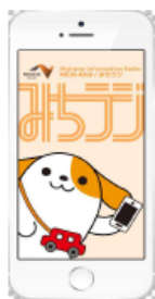
図-1 画面イメージ (アプリ起動時)