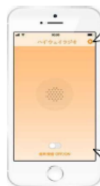
図-2 画面イメージ (音声受信時)

通行止の情報です。 ○○インターから●●インターまでの間で、事故のため、通行止めになっています。