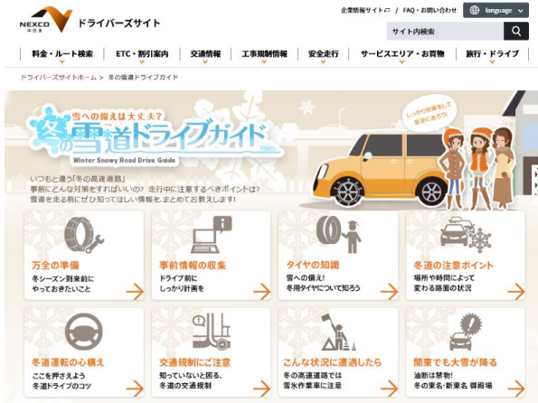
【WEB サイト 冬の雪道ドライブガイド】

冬道の注意するポイントや安全にご利用いただくための情報は、当社公式WEBサイト内の「冬の雪道ドライブガイド」[ https://www.c-nexco.co.jp/special/snow/ ]でご確認いただけるほか、SA・PAにてお配りしているリーフレット「NEXCO中日本 冬道走行に気をつけガイド」でもご紹介しております。